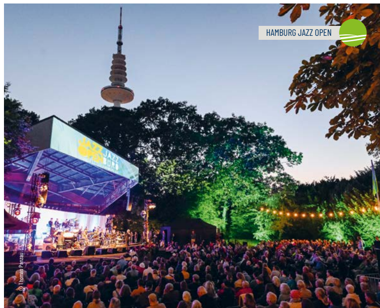
HAMBURG JAZZ OPEN